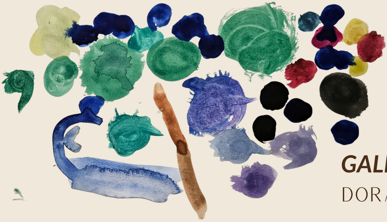
GALHO E JABUTICABAS DORA