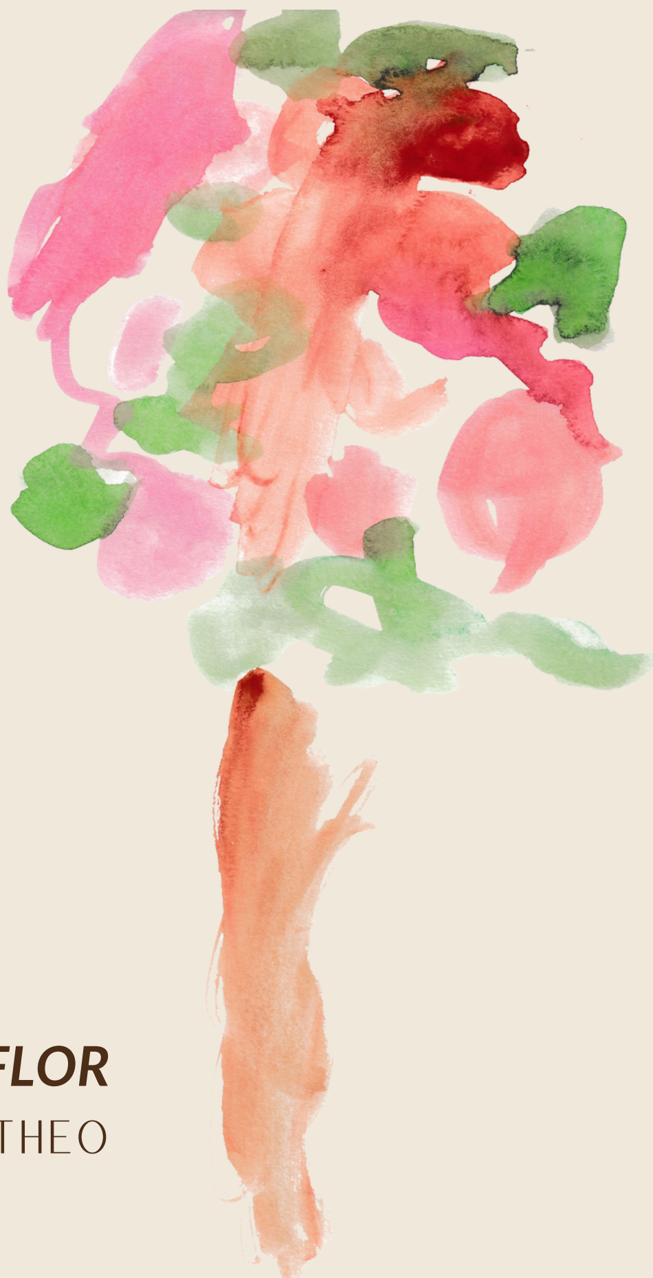
QUARESMEIRA EM FLOR THEO