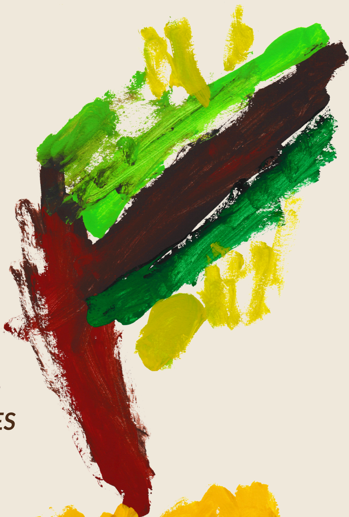
TAPETE DE FLORES MARINA