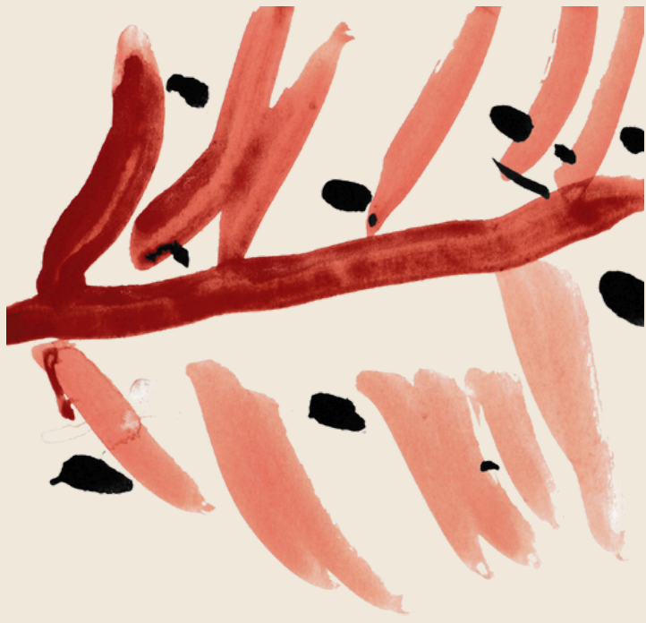
FOLHA SECA VICTORIA