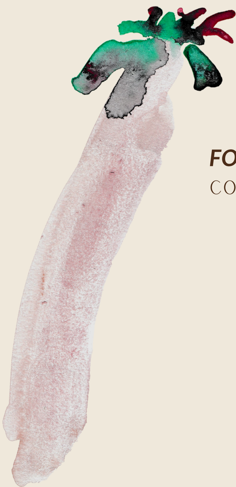
FOLHA E GALHO CORA