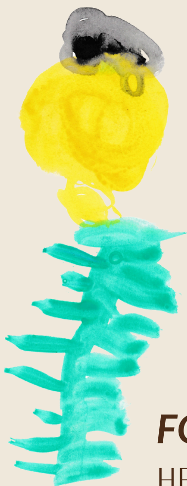
FOLHA E FLOR HELENA