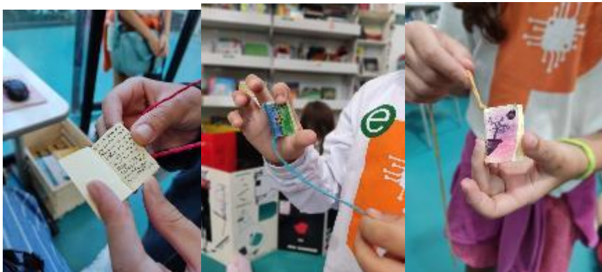
Figuras 4, 5 e 6 - Alguns dos minilivros produzidos nas oficinas.

Durante a aula, ao final da apreciação, foi realizada uma oficina de criação de minilivros, que seriam pendurados no pescoço como pingentes de um colar. Nasceram desde narrativas alienígenas e grandes feitos heroicos até simples histórias cotidianas.