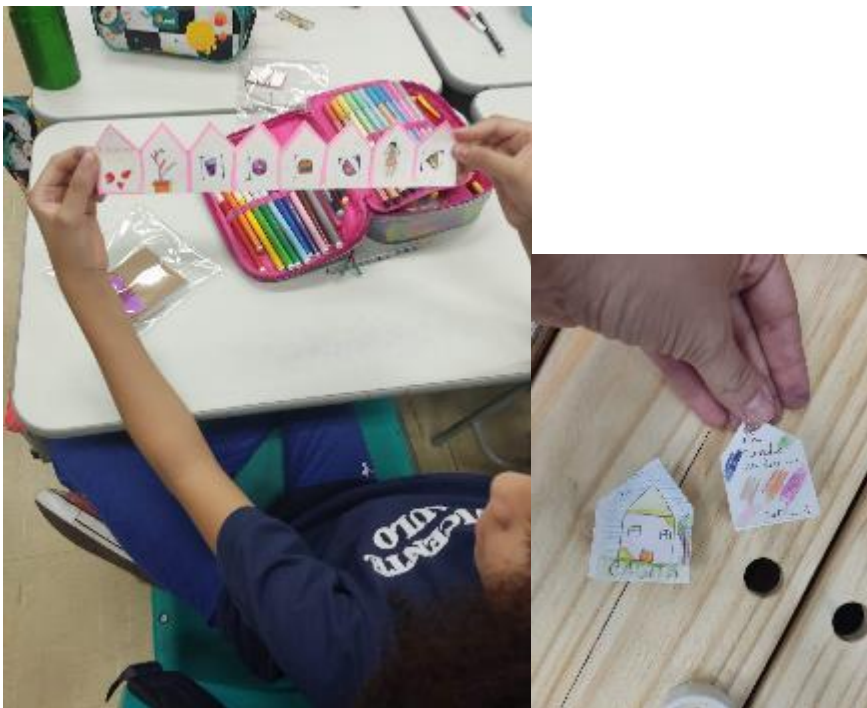
Figura 15 - Livro-casa de Laura, 10 anos./ Figura 16 - Livro-casa de crianças de 9 anos.

Mas esta casa é um livro, lembram? Em um livro, podemos sempre inventar. Um livro deve ser livre. No outro lado do livro sanfona, temos o avesso, mais oito páginas em branco. Lembro que este livro-casa também pode ter aquilo que na casa de verdade não é permitido e uma casa inventada dá outro sentido para a criação. A partir daí, eles não narram mais apenas suas casas, narram a si mesmos. Há casas de comida, casas com animais de estimação que já morreram, casas de bichos fantásticos, casas com todos os amigos, casas assombradas, casas malucas. Tudo é possível neste gesto de criar e de se narrar na relação com o papel e com a forma.