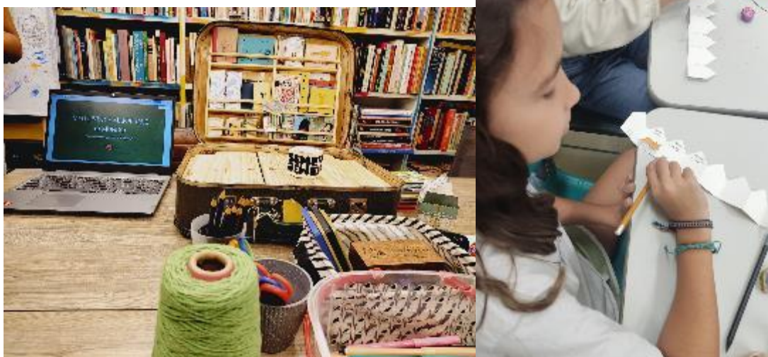
Figura 13 - A mala exposta durante a oficina, esperando para ser explorada./ Figura 14 - Criança no processo de criação de um minilivro durante oficina

Também observo com atenção a diferença entre as atitudes das crianças e dos adultos nas oficinas. As crianças, após terem o contato com os livros e seus diferentes formatos, sentem o desejo quase instantâneo de colocar a mão na massa. Apreciar essas obras é como um convite para elas, que leem as narrativas, observam os detalhes e perguntam, ansiosas: “Mas a gente vai fazer um livro assim também?”. Já os adultos, quando são convidados a criar, ficam apreensivos: “Mas eu não sei desenhar” ou “Não sei se consigo”. E é sempre uma satisfação quando percebem que concluíram a criação. As crianças se divertem no processo, menos preocupadas com o resultado. O que me faz entender melhor o porquê de a temática da infância ser mesmo um terreno fértil de exploração da materialidade no mercado editorial. Para Gandhi Piorski, isso se dá pelo caráter ensaístico da infância.