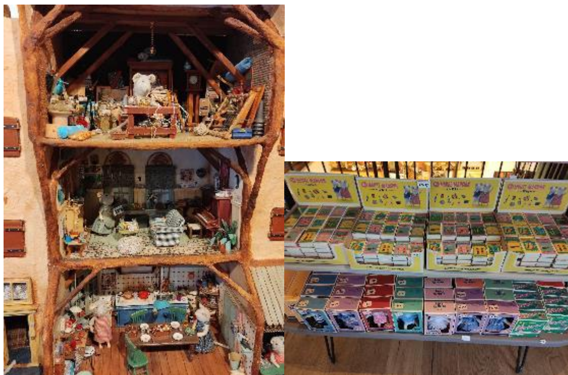
Figura 9 - Alguns dos cômodos da mansão dos ratinhos./ Figura 10 - Miniaturas vendidas em pequenas caixinhas

Em 2023, fiz uma viagem para Amsterdam e Londres. Na primeira cidade, fui conhecer o projeto da holandesa Karina Schaapman: Sam e Julia, The Mouse Mansion 1 . A autora tem um livro publicado no Brasil, pela editora WMF 2 . A história dos dois ratinhos, melhores amigos, Sam e Julia, é feita a partir de fotografias feitas dentro de uma mansão de 100 cômodos, toda em miniatura, criada pela autora. E eu estive lá, vendo todos os detalhes desse trabalho minucioso.