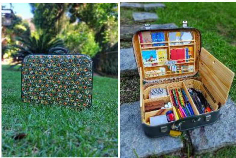
Figura 7 - A “Fabulosa mala dos menores livros do mundo”. / Figura 8 - A parte interna da mala.

Com as brincadeiras de narrar em pequenos caderninhos de papel, costurados ou grampeados à mão, as miniaturas voltaram a ocupar meu imaginário juntamente com os livros e cresceu uma vontade, daquelas insistentes de criança, de explorar mais esses universos, juntos, de alguma forma.