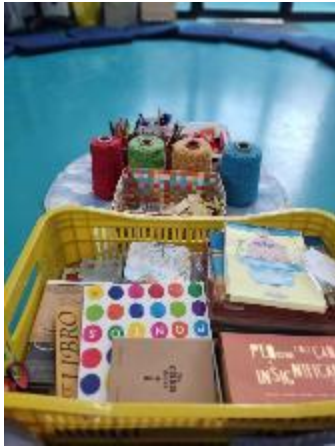
Figura 1- A caixa de livros que exploram a materialidade e material para oficina.