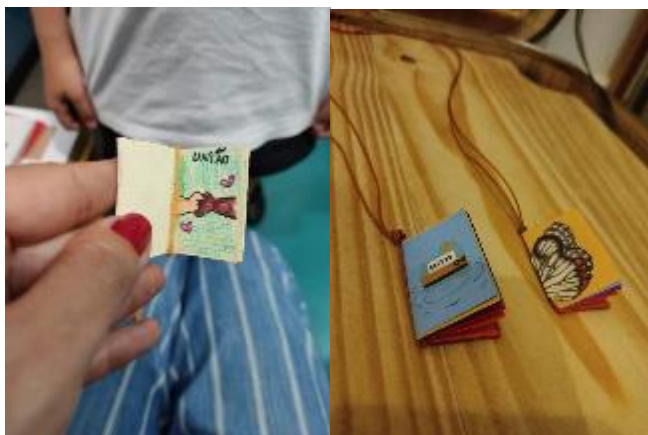
Figura 17 - Livro-amuleto com desejos para o mundo feito por crianças de 8 anos./ Figura 18 - Livros-amuleto de viagem e de segredos feito por crianças de 10 anos.

Ao final da oficina, as crianças escolhem suas cordas, de diferentes cores, para em um gesto de dar o nó no livro e colocar no pescoço, conectar seu corpo à sua narrativa.