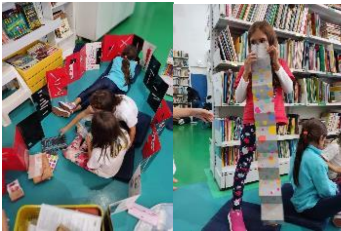
Figura 2 e 3 - Alunos explorando os livros da caixa durante as aulas.

Durante a aula, ao final da apreciação, foi realizada uma oficina de criação de minilivros, que seriam pendurados no pescoço como pingentes de um colar. Nasceram desde narrativas alienígenas e grandes feitos heroicos até simples histórias cotidianas.