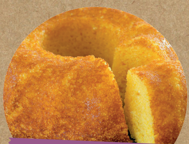
BOLO DE MILHO

Experimente os alimentos típicos de festa junina!